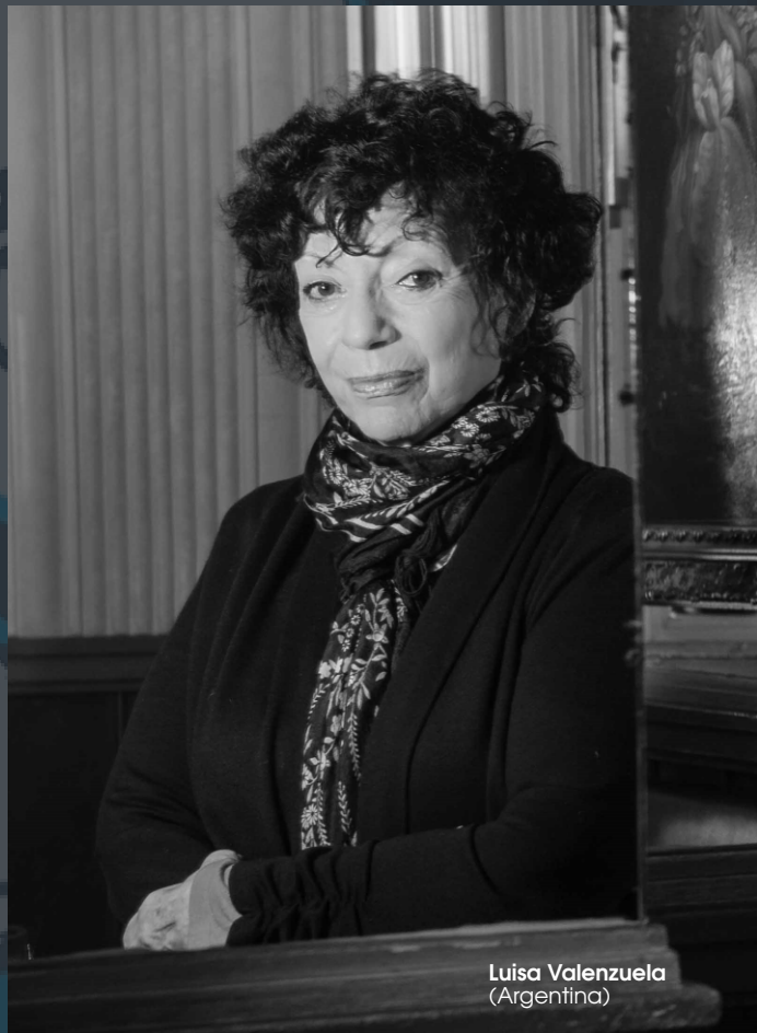
Luisa Valenzuela (Argentina)